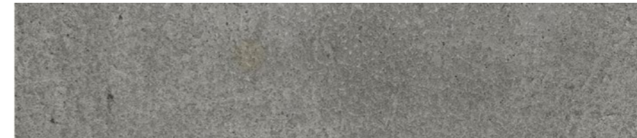
CON tratamiento PROCLEAN™ de Quadro, después de 24 h